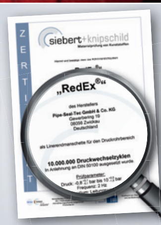
RedEx® – Zertifikat 10 Mio. Druckwechsel- zyklen von 10 bar bis -0,9 bar